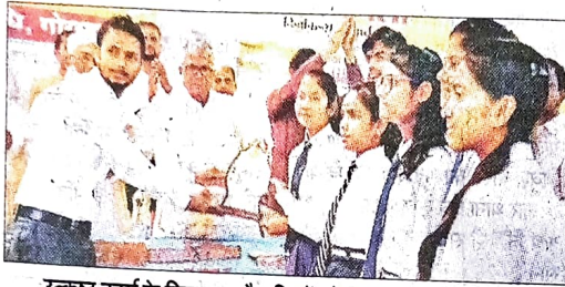
उत्कृष्ट कार्य के लिए बाल वैज्ञानिकों को किया गया पुरस्कर्त।

परतावल विकास खंड के सिसवा मुंशी रफीउल्लाह खान इंटरमीडिएट कॉलेज के परिसर में लगे विज्ञान मेले में भाषण, प्रश्नोत्तरी, पोस्टर प्रतियोगिता सहित विज्ञान के मॉडल प्रस्तुत किए गए। पनियरा विधायक